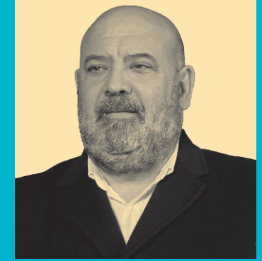
JAIME MARTÍNEZ LLABRÉS Alcalde de Palma

En este primer año como alcalde de Palma me hace especial ilusión felicitar a toda la ciudad con ocasión de nuestras Fiestas de Sant Sebastià. Nuestro patrón protegió Palma de la epidemia de la peste en el siglo XVI y precisamente este año conmemoramos el quinto centenario de la llegada de la reliquia de Sant Sebastià a la Catedral. En su honor celebramos año tras año el orgullo de pertenecer a esta maravillosa ciudad.