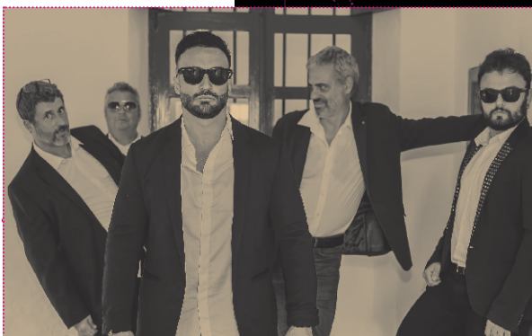
Tardes en el Cafè

EN LA PL. MAJOR a las 20 h Tardeo Verbena Sant Sebastià balla con Tardes en el Cafè y Valnou